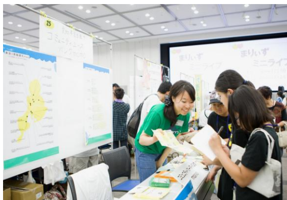
【ブース出展】 DECO スクール 2011