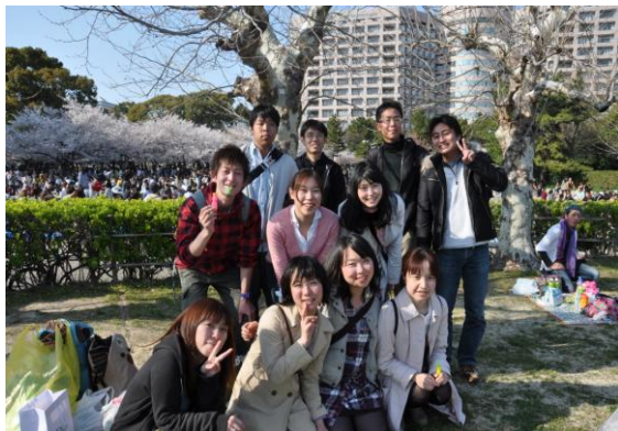
【イベント】 momo お花見 2012