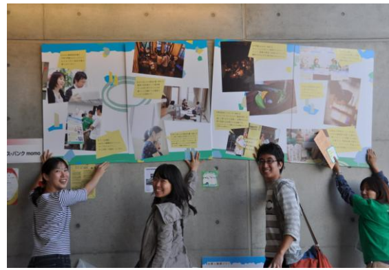
【ブース出展】 愛フェス 2011