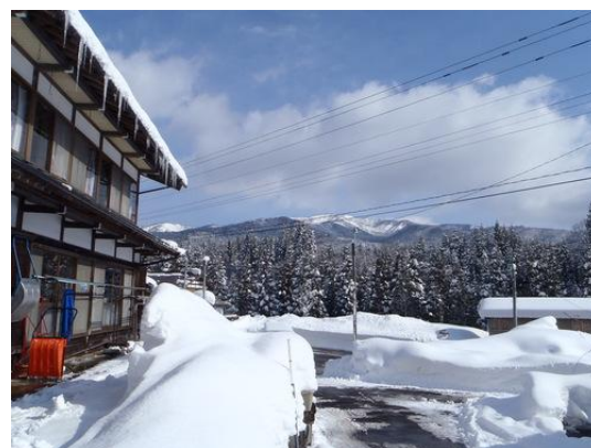
【融資先】農園サユールイトシロ 生産効率化のための機械化事業