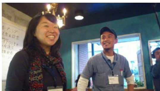
【融資先】合同会社 yaotomi 野菜販売事業