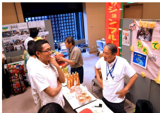
【イベント】 momo 感謝祭